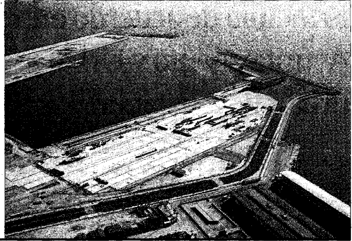
Imágenes aéreas de la nueva circunvalación de Alicante –izquierda– y de las obras de ampliación del Puerto de Alicante