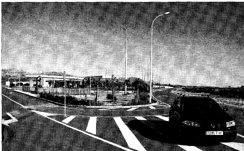
Área de servicio de la autopista, situada entre las salidas de San Vicente y Monforte.